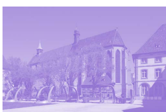
Église Saint Matthieu