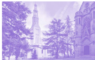
Église de Logelbach