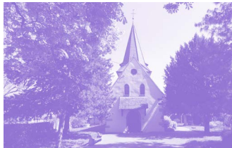
Église Saint Michel Horboung-Wihr